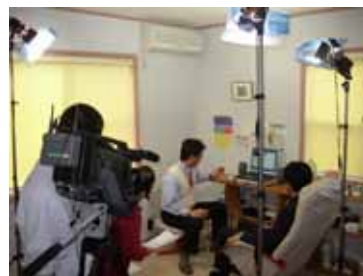
スターライトの説明用ビデオ撮影状況。ビデオはまもなく完成します。

スターライトをご理解いただくための説明会をおこないます。今回のオーナーひとり言で紹介されましたベットと磁場とスピン反転の関係などについても詳しくご説明いたします。参加者全員に、自動セラピーによるホルモンバランス修正を体験していただきます。