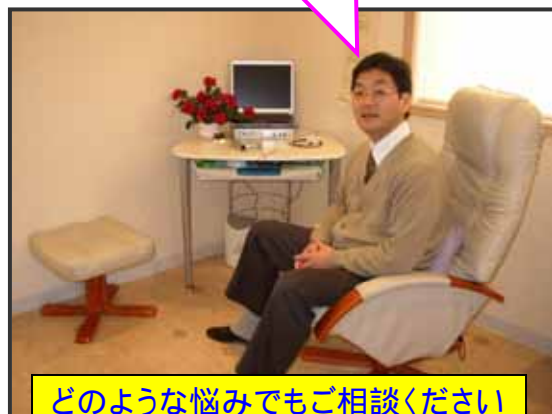
どのような悩みでもご相談ください

4月から1階に、スターライトと一緒に降りてきました。ご来店された皆さんにいろいろな情報を直接お伝えしたいと思いますので、是非おでかけください。オーナー