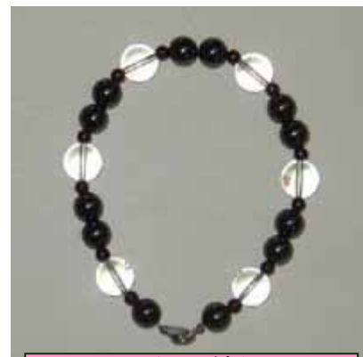
ヘマタイト付きの プレメイヤプレスレット